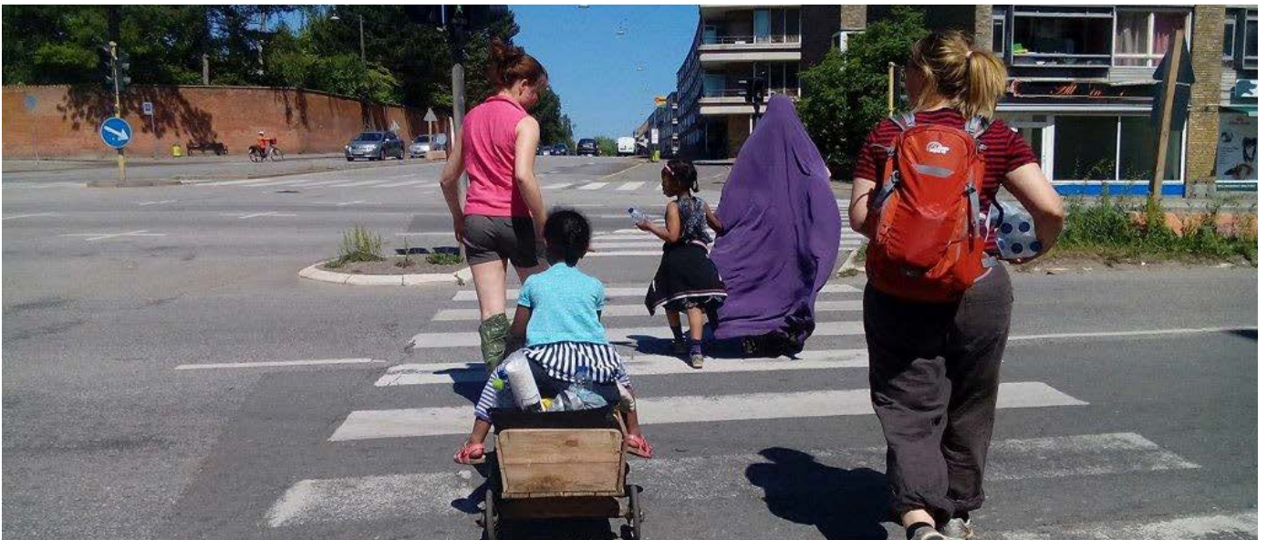
Ud af boligblokken - ind i naturen, Red Barnet