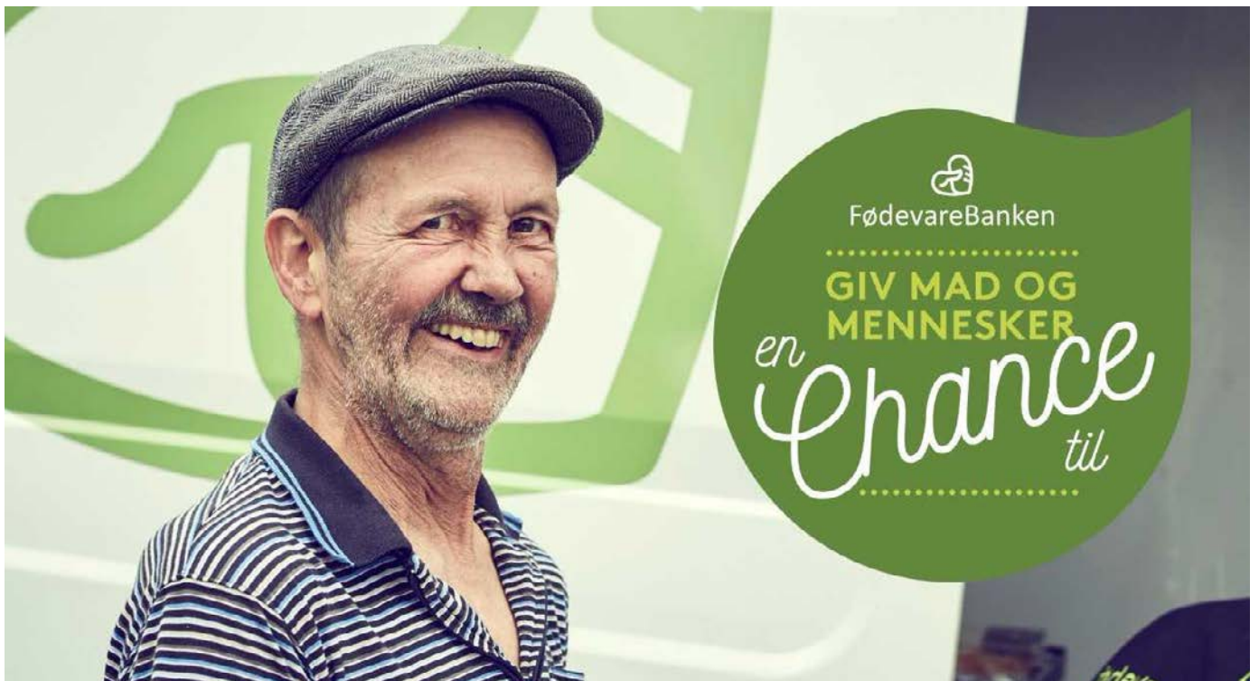
Giv mad og mennesker en chance til, FødevarerBanken