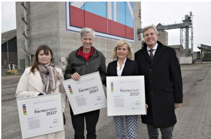
Jyske Bank modtager Farveprisen

Prisen er tildelt for den gode og farverige fortælling, som "Det røde bånd" repræsenterer: Godt håndværk og farver går i eet og bliver et vartegn samtidig med, at kulturen og byens historie elegant bliver flettet sammen på den grå patinerede beton. Prisen gives ydermere for et fortrinligt samarbejde mellem kunst og uddannelse.